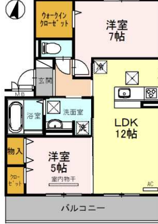
101号室 2LDK (60.88)