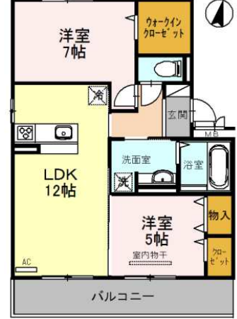
302号室 2LDK (60.88)