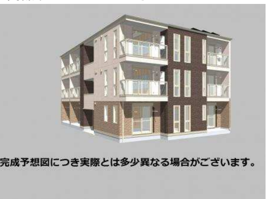
完成予想図につき実際とは多少異なる場合がございます。