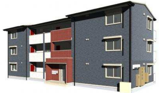
完成予想図のため、実際とは異なる場合があります