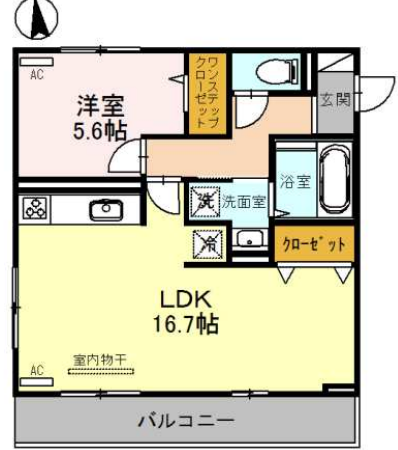
303号室 1LDK (53.82)