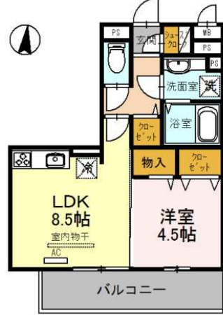
211号室 1LDK (37.03)