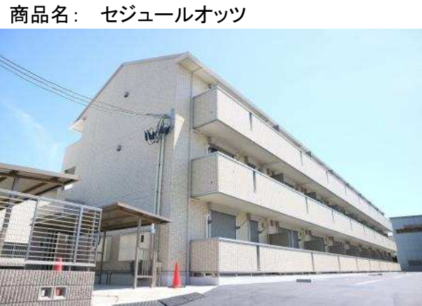
※パース写真の場合は、現況優先とします。