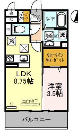
103号室 1LDK (33.39)